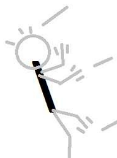
Bumbling backslash falls backwards

table de 7 7 14 21 table de 8 8 16 24 table de 9 9 18 27